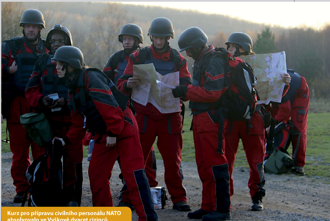
Kurz pro přípravu civilního personálu NATO absolvovalo ve Vyškově dvacet cizinců