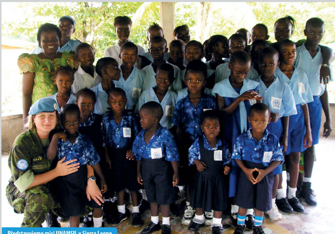
Představujeme misi UNAMSIL v Sierra Leone